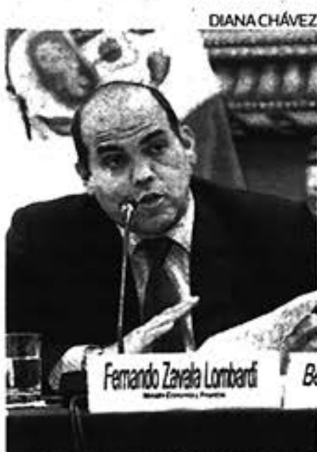
Zavala. Optimista con el PBI.