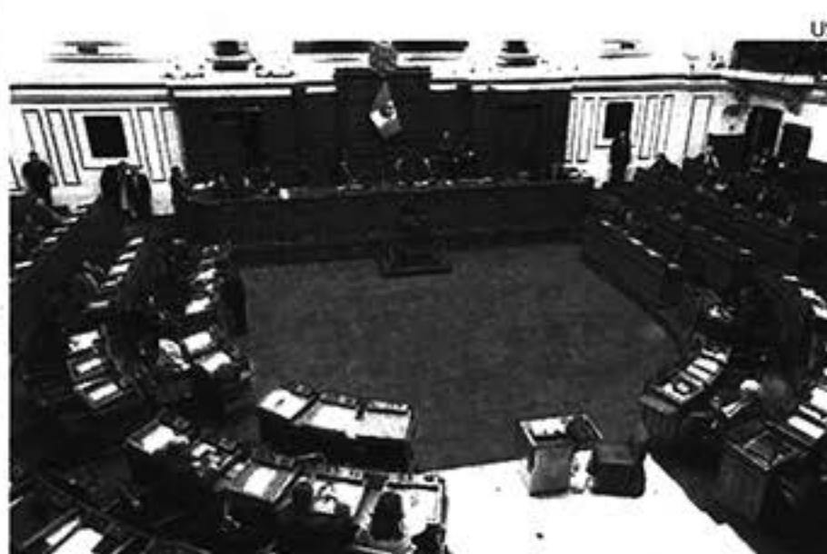
Pleno. Comisión espera que proyectos se aprueben por el Congreso.