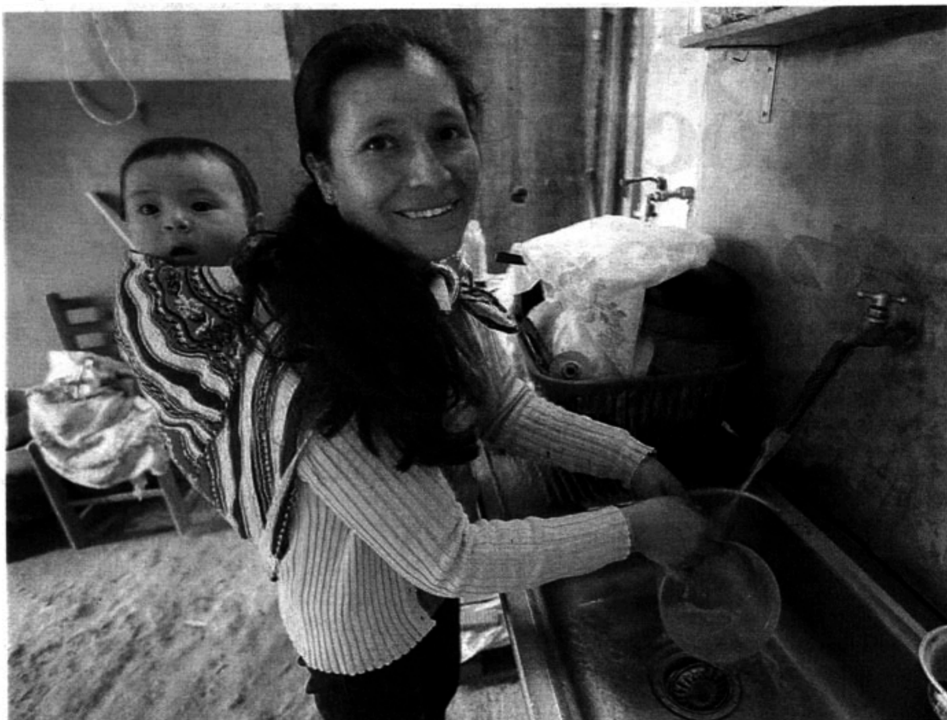
Casi habríamos alcanzado la meta en Lima, según el Gobierno.

Perú ha seguido el camino inverso. En 1994 la responsabilidad de los servicios de saneamiento se transfirió del gobierno central a los gobiernos locales, salvo Lima, y 49/50 empresas prestadoras son públicas (aunque hay concesiones parciales recientes, verticalmente desintegradas, para PTARs principalmente). Resultado: agua potable 89.2%; alcantarillado 79.3%. (ENAPRES: 2016), y TAS 65%, zonas urbanas (SUNASS: 2016).